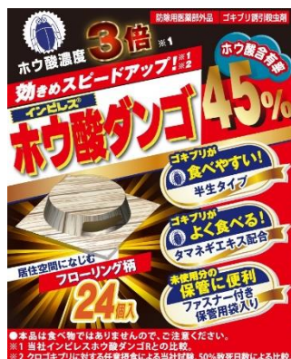
インプレス®ホウ酸ダンゴ 45% 24P