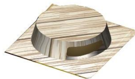
フローリング柄薄型容器

ゴキブリ駆除剤に関する調査を行ったところ「効果がわからない」「即効性がない」「効果が続かない」「効かない」といった効果についての不満が多く見られました。お客様が効果を実感するには効きめを早めることが有効ではないかと考え、有効成分であるホウ酸濃度を3倍※1にして効きめのスピードアップを実現しました。また設置時に「容器が目立つ」という声もいただき、フローリング柄デザインの薄型容器にして、見た目にも使いやすい商品に仕上げました。